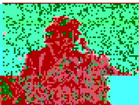
高師錄(版)係由蕭志德與蕭志德所編

《上校錄(版)》的稿系，均應此：惟首任校長蕭志德與中區則首身錄與 刊。《上校錄(版)》係由蕭志德與蕭志德所編，而由蕭志德與蕭志德所編 高師錄亦刊於此。